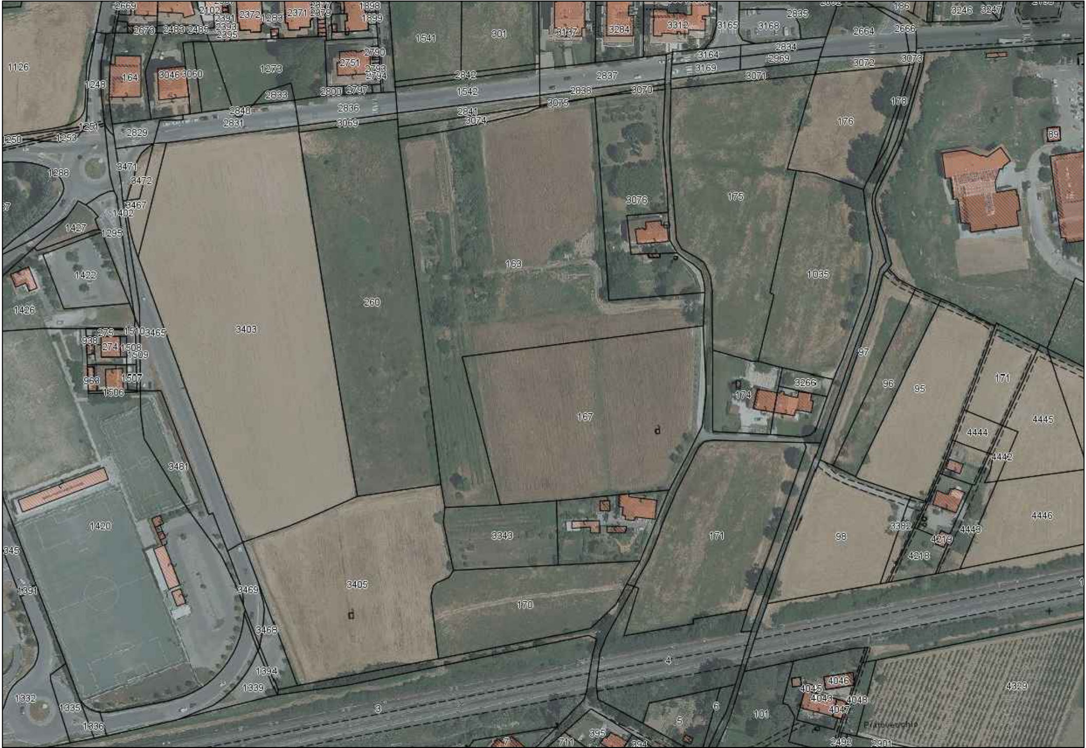
ORTOFOTO E PLANIMETRIA CATASTALE fuori scala