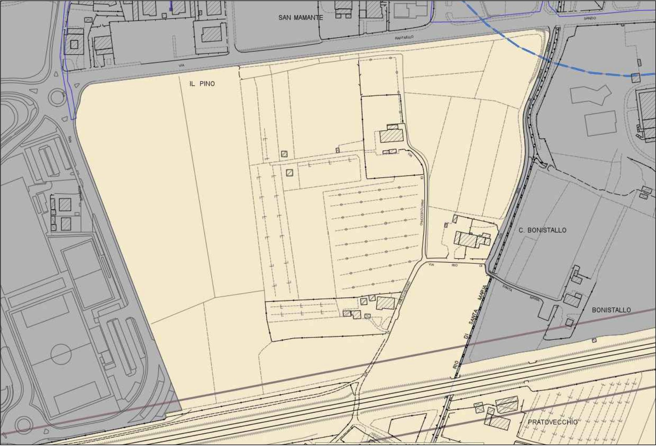
ESTRATTO REGOLAMENTO URBANISTICO COMUNE DI EMPOLI CARTA DELLE SALVAGUARDIE E AMBITI DI RISPETTO fuori scala