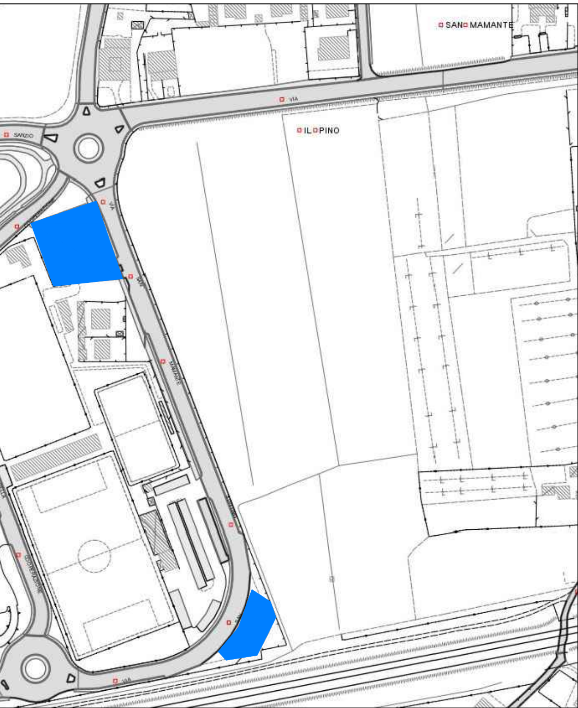
ESTRATTO CARTA TECNICA REGIONALE IDENTIFICAZIONE AREE PARCHEGGIO ESTERNE PER VERIFICA PUNTO 6.3 DELIBERA CONI 149/2018 fuori scala